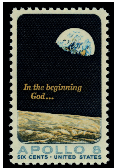
Frimärket som det amerikanska Postverket gav ut till minne av Apollo 8:s månfärd.