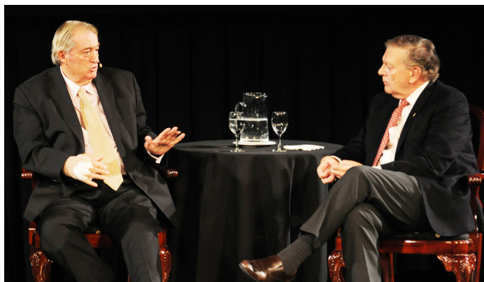
Äntligen träffades två av världens ledande paleoantropologer. I trettio år vägrade Richard Leakey t.v. och Donald Johanson att träffas och kritiserade istället varandra häftigt i olika böcker och artiklar.

Bråket mellan Richard Leakey och Donald Johanson hör till de mera kända. I över 30 år talade