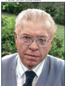
Fred Hoyle , världsbekänd brittisk astronom och kosmolog, som enligt många bedömare blev snuvad på Nobelpriset.