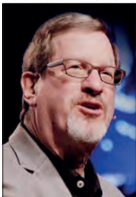
Lee Strobel, kriminalreporter och prisbelönt författare