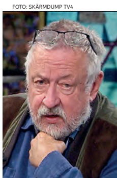
Leif GW Persson

Då har kriminalprofessorn Leif G. W. Persson betydligt större chans att lösa de ouppklarade brottsfall han på senare år granskat. Anledningen till det är att han är så nyfiken på en del av fallen att han t.o.m. skulle kunna tänka sig att betala en miljon ur egen ficka för ett avgörande tips som bidrar till att lösa gåtan kring något av de ouppklarade fallen. Detta säger han i en intervju med tidningen Expressen i september 2011.