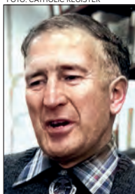
Antony Flew (1923-2010) professor i filosofi, känd som en av världens mest ledande ateister.

Boken skildrade Flew som metodistpastorns son, som växte upp i en kyrklig miljö. Men gudstjänstbesöken, sångerna och bönerna gav honom ingenting. Han var helt ointresserad av musik och kristen litteratur och såg ingen mening i att rabbla böner och besöka gudstjänster. Det var helt andra intressen som upptog Antony Flew under barndomen än de som hans pappa var engagerad i. Det som intresserade Antony var i stället filosofi, historia och naturvetenskap. Redan som 15-åring var han en övertygad ateist.