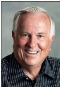
Josh MacDowell, teolog, apologet och författare.