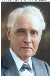
William Ramsay, fil dr vid Oxfords universitet och berömd arkeolog