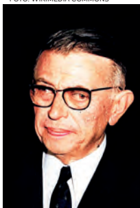
Jean-Paul Sartre, nobelpristagare i litteratur år 1964.