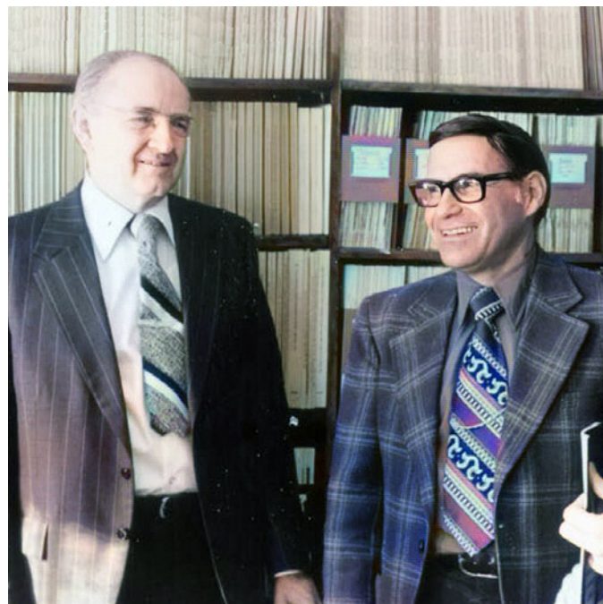
Duane Gish t.v. och Henry M. Morris