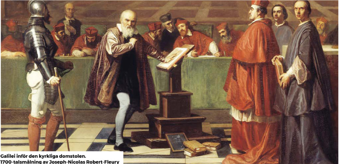
Galilei inför den kyrkliga domstolen. 1700-talsmålning av Joseph-Nicolas Robert-Fleury